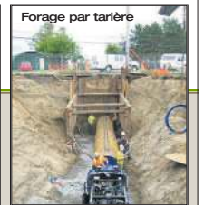
Forage par tarière