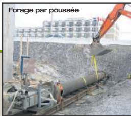
Forage par poussée