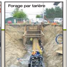
Forage par tarière