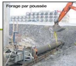
Forage par poussée